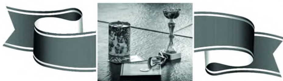
Талинские спортсмены тоже порадовали нас своими победами и достижениями: